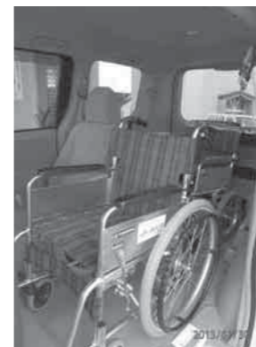
スロープ付き自動車 (車イス2台乗車可能です)