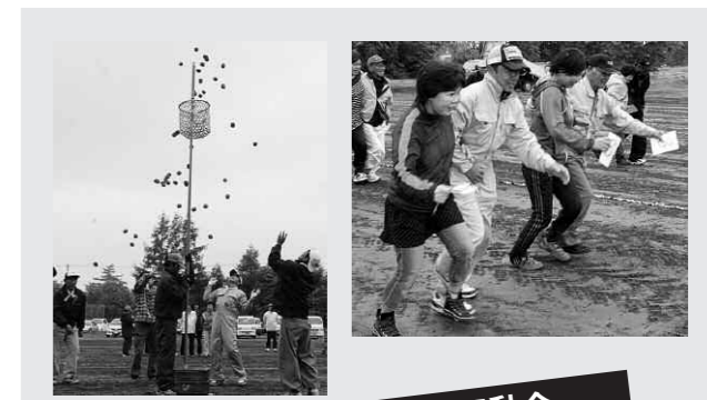
6/24十弗地域住民運動会