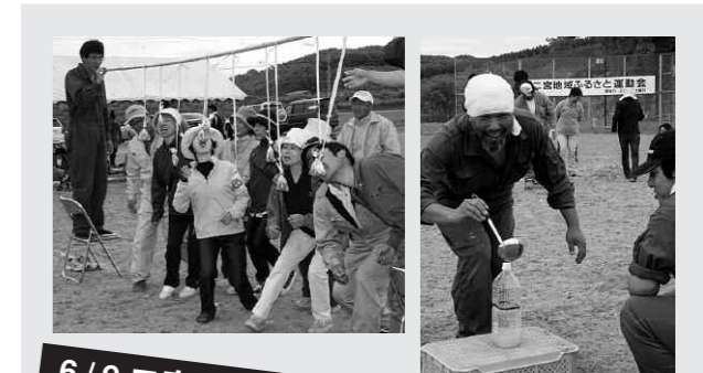
6/9二宮地域ふるさと運動会