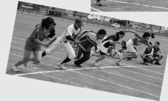
5/27豊頃中学校体育祭