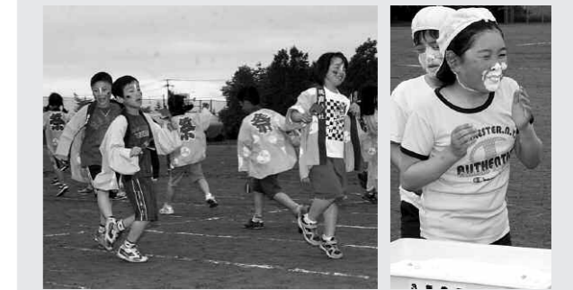
6/10豊頃小学校大運動会