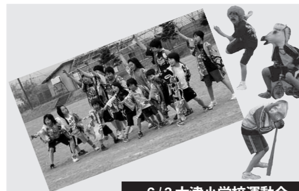
6/3大津小学校運動会