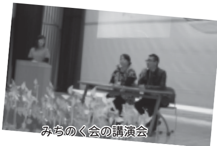
みちのく会の講演会

2011年3月11日、戦後最大の震災と言われている東日本大震災... 東北地方は姉妹都市相馬市など被災地と大変ゆかりのある豊頃町。遠方においても被災地のために何か支援が出来ないものか、町民の皆さんの震災復興への気持ちと被災地支援を通じたボランティア意識の普及や増進の意味も込め実施しました。 被災者の生の声「あの日の出来事と被災地の今」講演や、ボランティアさんによる爆笑余興発表、相馬市の特産品の販売など、当日は300名近くの来場者が訪れ賑わいました。 東北がんばっぺ祭りの様子をご紹介します。