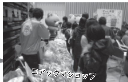
コアックマショップ