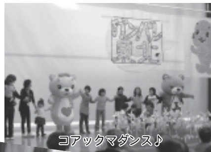
コアックマダンス!