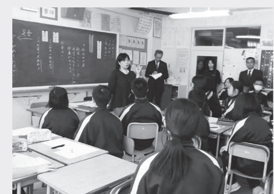
写真②豊頃中報徳の授業

子どもの考えを深めるために、資料の提示の仕方や使い方を工夫し、資料を生かしていました。道徳の授業と報徳の授業をどのような考えで実践すべきか明確にする必要があります。子どもの生活には、考えさせたい内容が数多く含まれている。子どもの発達段階や地域の実態や環境や歴史から考える考え方を視点として考慮すべきであります。子ども達に弱い心や強い心を教えてあげなければいけない時代です。反省するだけでなく、種をまくことが大切であります。子どもたちの心を耕してあげたいと思います等々。研究協議を通して、先生方の子ども達への思いが伝わってきました。