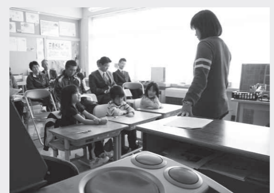
写真①大津小報徳の授業

エル君 夢ちゃんの10x10x10 ○学校では、道徳の授業で「子ども報徳訓」が生活の中に息づいてほしいという取組みがなされていくんですね。 ○子ども達の生活の中で大切にしたいことを様々なテーマで子ども達に考えさせているのね。「報徳のおしえ」の四綱領に通じる感じがしますね。 ○研究協議を聞くと道徳の授業と報徳の授業とのかかわりを明確にすることが課題となっているようだね。 ○大人も子どもも日常の暮らしの中で子ども報徳訓に示されていることが、ふと心に浮かぶようになると幸せな町になるわね。 ○豊頃町に生きる子ども達と先人のたくましい開拓精神と「報徳のおしえ」を受け継ぎ、明るく生き生きと豊頃町に息づく人に育ってほしいと願うね。 子ども報徳訓を生活に生かして！