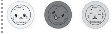
マグネット 43mm 200円