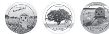
缶バッチ 57mm 100円