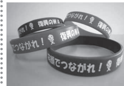
シリコンバンド ~復興のWA~ 震災義援金になります 300円