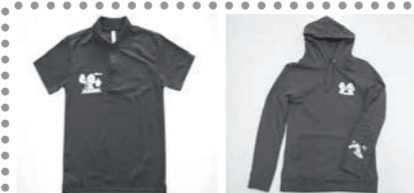
衣類 完全受注販売 ドライTシャツ 2,500円 ドライポロシャツ 3,000円 ジップパーカー 4,300円 パーカー 3,500円