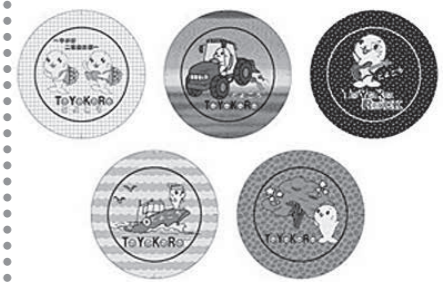
缶バッチ 31mm 50円