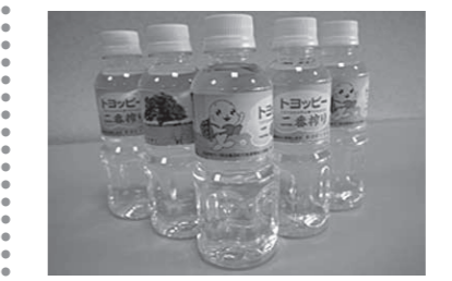
ミネラルウォーター 140円