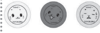
ストラップ 25mm (缶バッチ型) 200円