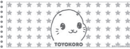
フェイスタオル 500円