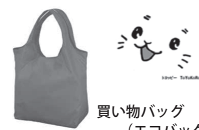
買い物バッグ (エコバッグ) 1,300円