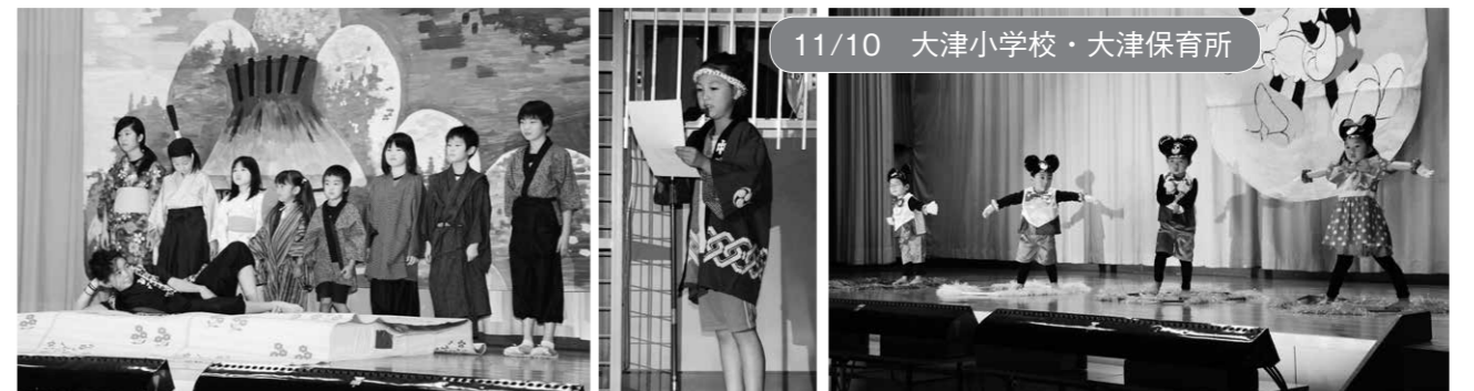
11/10 大津小学校・大津保育所