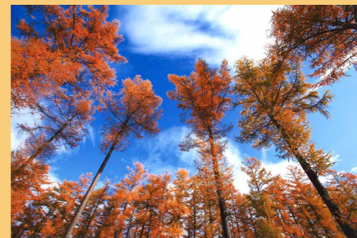
【特選一席】豊頃町観光協会賞 高木 皓「カラマツの彩り」