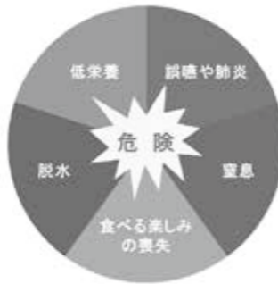
嚥下障害を放っておくと

※誤嚥性肺炎とは、口の中にある細菌を含むだ液や食べ物、胃液などを肺へと吸い込んでしまう（誤嚥する）ことによって起こる肺炎です。高齢者の肺炎の多くが誤嚥性肺炎であるといわれており、65歳以上の高齢者の肺炎の70%以上が誤嚥性肺炎であるといわれています。