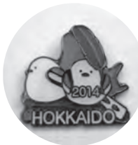
北海道限定「シマエナガ」