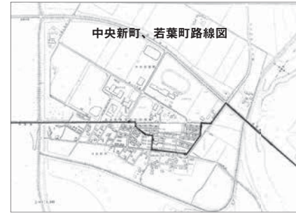
中央新町、若葉町路線図

コミバス運行路線に雪を排雪しないようお願いいたします コミバス運行路線の道路に、除雪後に排雪されずと運行の支障となり路線を通過できない場合がありますので、運行路線の道路には排雪しないようご協力をお願いします。