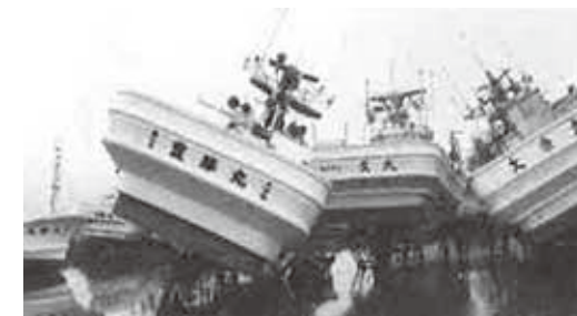
平成15年の十勝沖地震の被害の様子