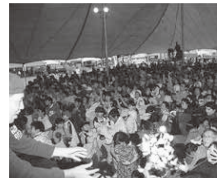
第1回とよこ産業まつりの様子

豊頃町は平成27年1月1日で町制施行50周年を迎えました。昭和40年に町制施行されてからの本町の歩みを写真を交えながら紹介していきます。