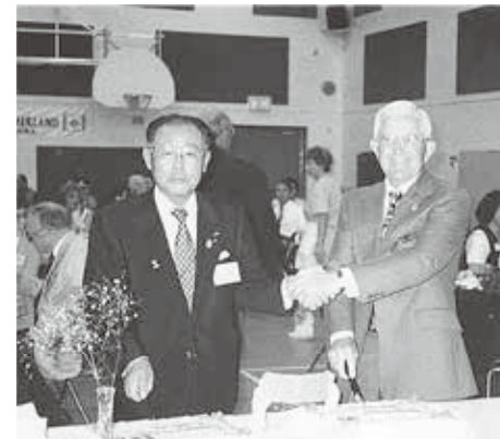
サマーランド市との姉妹都市締結式の様子