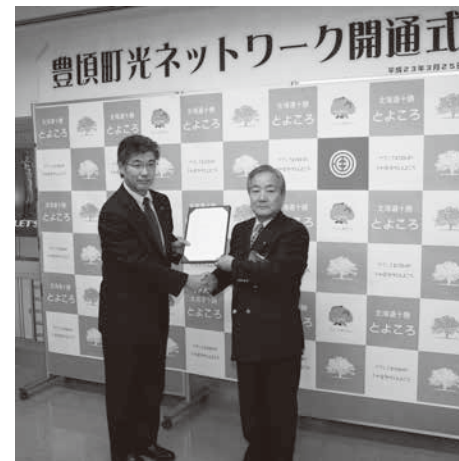
町光ネットワーク開通式の様子