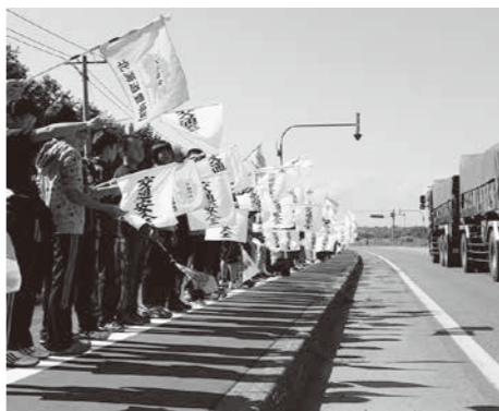
豊かな資源を生かしたまちづくり

体制の充実を図ってまいります。第9次交通安全計画に基づき、道路交通における安全対策の取り組みを進めてきましたが、本年度で計画期間が終了となることから、交通事故のない安全で安心な社会を目指して「層の交通安全対策を推進するため、次期計画を策定していきます」。