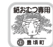
紙おむつ専用シール

「コミュニティバス」をお気軽にご利用ください 茂岩⇄豊頃を1日5往復しています。町では平成22年から市街地における町民の足として、コミュニティバスを運行しています。 茂岩栄町と中央新町を経由して豊頃駅までの間を片道約20分前後で1日5往復していますので、どなたでも買物、通院のほか、ちょっとした用事でも、お気軽にご利用ください。 運行日▽平日のみ運行(土・日・祝日、12月31日から1月5日を除く) 利用方法▽特定の停留所はありません。図の運行路線であれば、どこでも乗り降りできます。 運行表で、通過時間を確認し、少し早