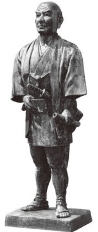
二宮尊徳 廻村の像