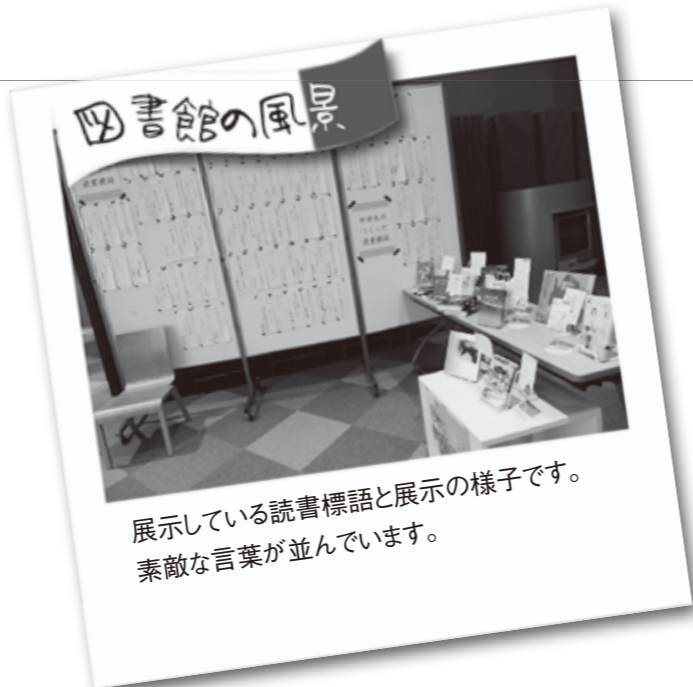
展示している読書標語と展示の様子です。素敵な言葉が並んでいます。