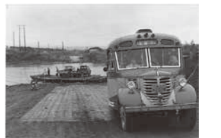
茂岩橋完成前の渡船 (昭和20~30年頃)