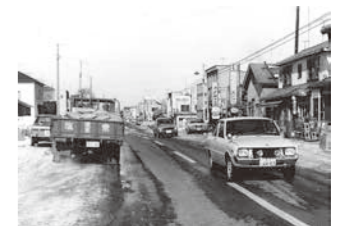
茂岩市街地の様子 (昭和40~50年頃)