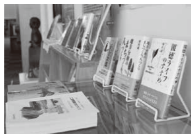
報徳にまつわるリーフレットが並ぶ

飛行機やインターネットがない時代にどうやって北海道へ来たのか：興味はありませんか。今となつては本で知るしかありません。ぜひここにある1冊で知的好奇心を満たしてください。 「報徳」図書コーナーから少し進んだ先の階段を上がつて2階「歴史の森」へ。こちらでは当時使っていた測量器具など、歴史を感じられる道具の数々を見ることが出来ます。 壁面には貴重な資料と共に説明があり、ひとつひとつ丁寧に丁寧に読んでいくことで、豊頃町の礎となった人々の苦勞や努力を知ることが出来るはずですよ。 「報徳」図書コーナーへ、歴史の森へいつでも閲覧可能です。える夢館に来られた際は、ぜひ一度ご覧ください。