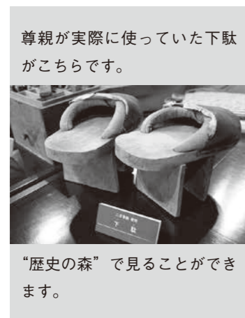
尊親が実際に使っていた下駄がこちらです。

飛行機やインターネットがない時代にどうやって北海道へ来たのか：興味はありませんか。今となつては本で知るしかありません。ぜひここにある1冊で知的好奇心を満たしてください。 「報徳」図書コーナーから少し進んだ先の階段を上がつて2階「歴史の森」へ。こちらでは当時使っていた測量器具など、歴史を感じられる道具の数々を見ることが出来ます。 壁面には貴重な資料と共に説明があり、ひとつひとつ丁寧に丁寧に読んでいくことで、豊頃町の礎となった人々の苦勞や努力を知ることが出来るはずですよ。 「報徳」図書コーナーへ、歴史の森へいつでも閲覧可能です。える夢館に来られた際は、ぜひ一度ご覧ください。