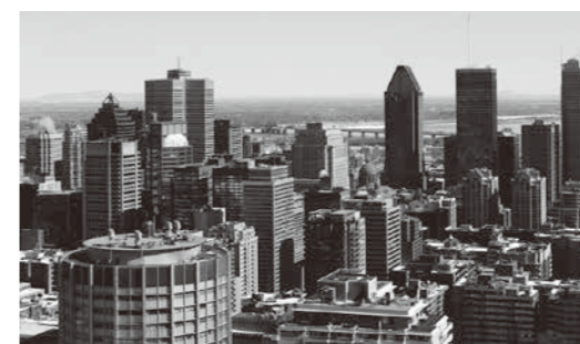
モントリオールの街並み

カナダの大学生や高校生は学期の終わりを迎えています。学生たちは4月末に授業やテストを終えます。カナダでは大学は2学期制で、秋の学期は9月から12月まで、冬の学期は1月から4月までです。大学生は4ヶ月間の夏休みがあります。夏休みの間、学生たちは特別な授業を履修したり、仕事をしたりします。私が大学生のとき、夏休み中はモントリオールにある科学研究所で働いていました。とても楽しかったです！