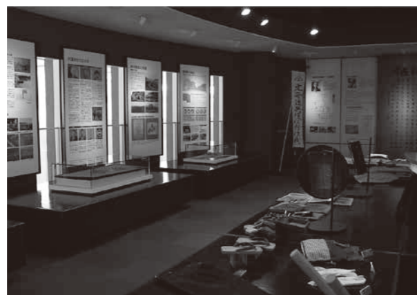
「歴史の森」の様子。当時の生活雑貨が並ぶ