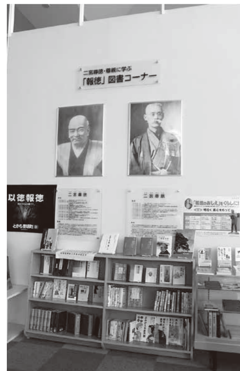
「報徳」にまつわる数々の本