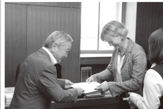
7月4日の辞令交付式の様子

I have been living in Victoria, Canada for 3 years. In Victoria, I studied to become a teacher of high school English and English as a Second Language. Before that, I lived in Summerland for 21 years. I have 2 very tall sons, who go to university in Kelowna, B.C., Canada and St. Louis, Missouri, U.S.A.. I am tall, but in my family I am the short one. I have an older sister and a younger brother, who are also taller than I am.