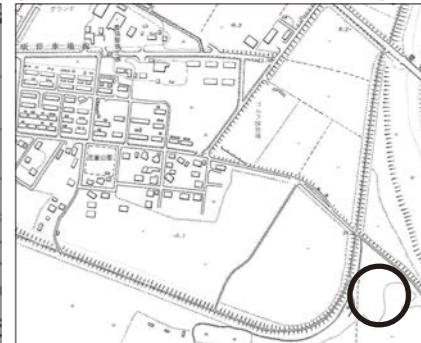
【市街地付近の礼文内川堤外河川敷地（中央新町）】