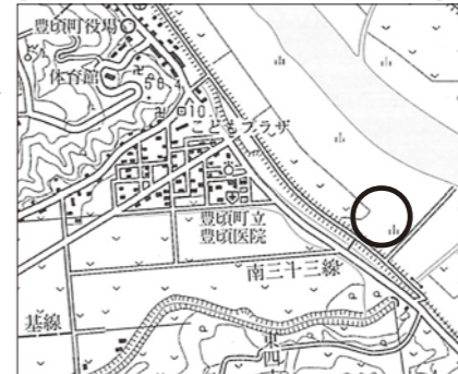
【下水浄化センター付近の十勝川堤外河川敷地（茂岩）】