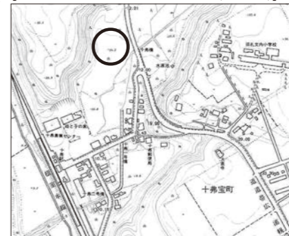
【市街地付近の日砂利取場敷地内所有地（十弗宝町）】