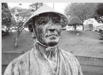
役場駐車場前にある尊徳像

これから広報とよころで『報徳のおしえ』とともにシリーズで掲載し、町民の皆さまに紹介してまいります。