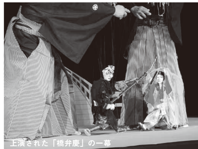
上演された「橋弁慶」の一幕