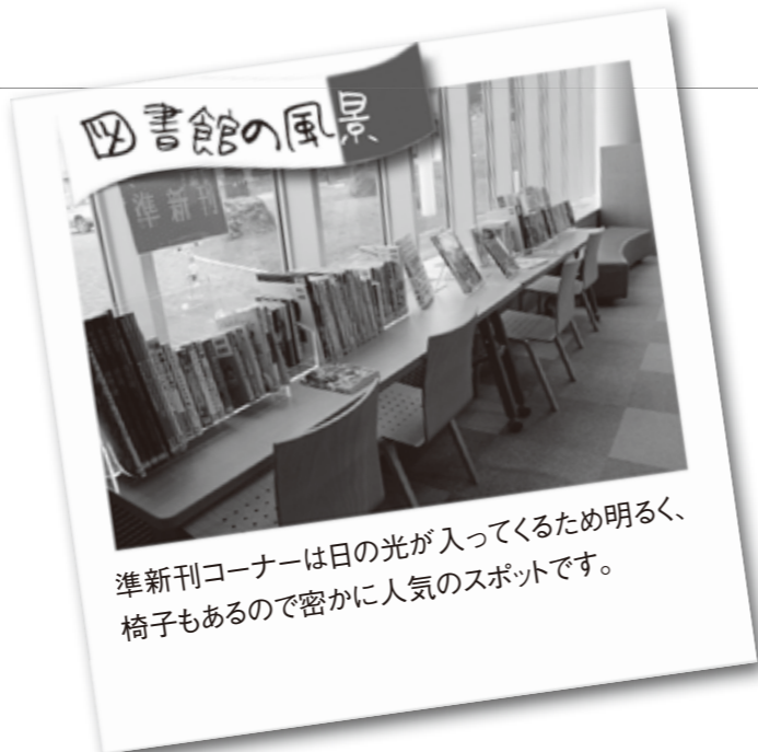
準新刊コーナーは日の光が入ってくるため明るく、椅子もあるので密かに人気のスポットです。

おでん、銭湯、落語家など、同じ日本なのに東と西ではこんなに違う！見開きで東と西の写真が載っているので、違いが一目瞭然です。起源や文化の解説もあり、読み物としても大満足の一冊です。(伊藤)