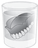
入れ歯は水中保管が基本！

答えは × 入れ歯の材質は熱や乾燥によって変形等を起こすので熱湯消毒や天日で乾燥させてはいけません。お口から外した入れ歯の保管は水中保管が基本です。