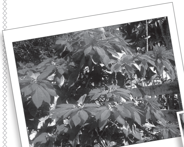
道路脇にあったポインセチア

一週間後には、大津の海を散歩をして楽しみました。ジュエリーアイスを探しに行き、とても綺麗な景色を見ることができましたが、「Tシャツとジーンズの天気」ではありませんでした。