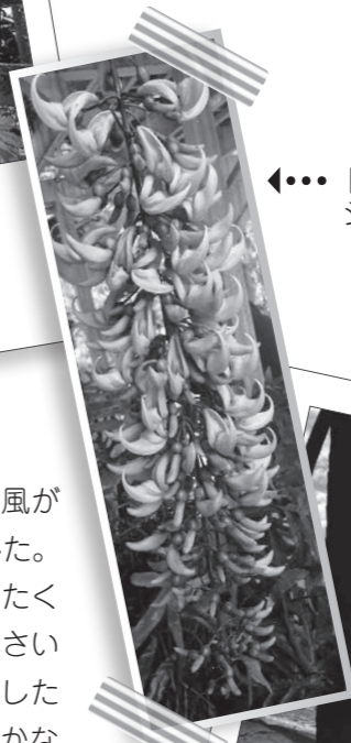
←...トルコ石のような色のジェイド・パイン (ヒスイカズラ)