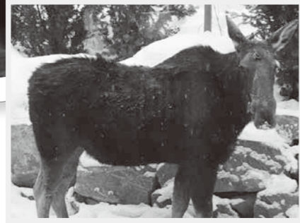
庭に来たメスのヘラジカ

角がないので、メスだと思います。オスの場合、わずか1才のころから角が生え始めます。このシカは、子どもにしては大きすぎますし、メスはオスほど大きくなりません。