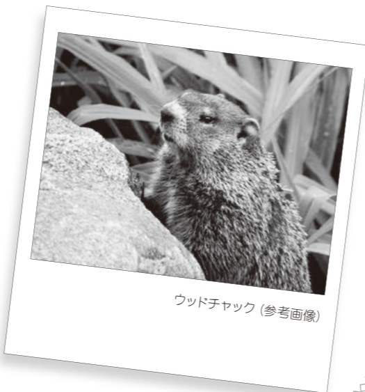
ウッドチャック(参考画像)

これはヘラジカにとって、とても難しいことです。重い体や長い脚は深い雪では容易に動かせません。