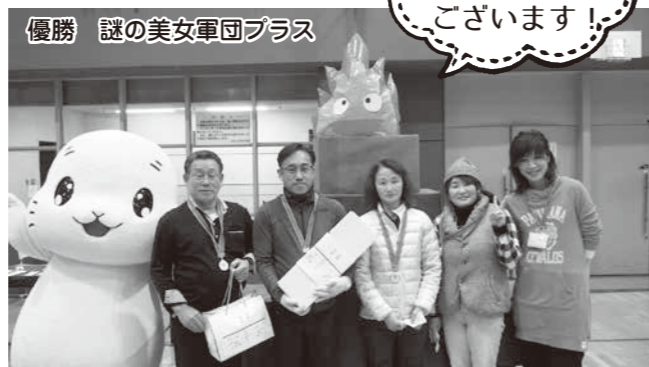
優勝 謎の美女軍団プラス