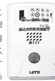
▲通話録音装置「振り込め詐欺見張隊」

相手からの電話着信時に「この電話は振り込め詐欺等の犯罪被害防止のため、会話内容が自動録音されます」とアナウンスを流し、通話内容を自動録音する装置です。アナウンスによる警告を行ない通話内容を録音することで、振り込め詐欺や悪質な電話勧誘等を抑止することができます。