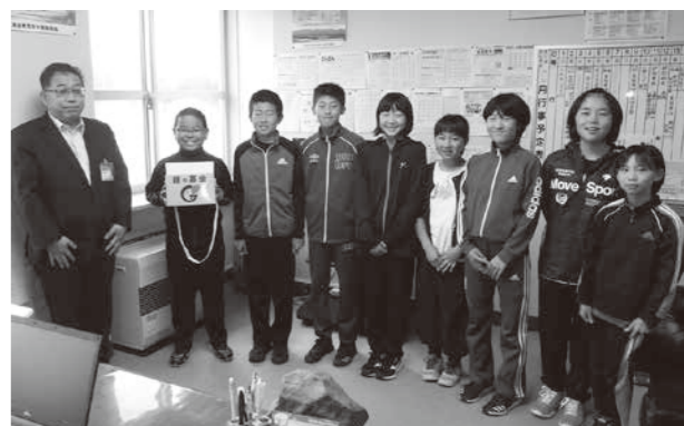
豊頃小学校児童会