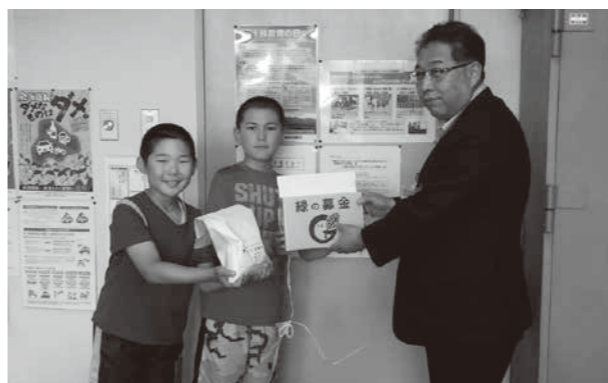
大津小学校児童会