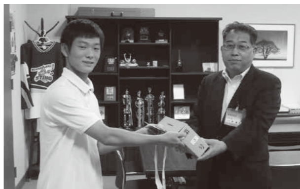
豊頃中学校生徒会