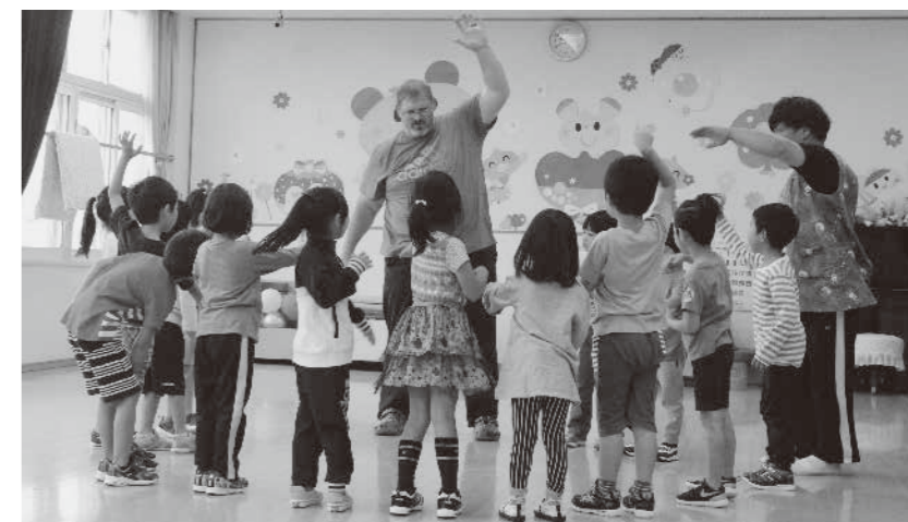
保育所では子どもたちに、ときどき日本語を交えながら英語で話しかけます。「Walk (歩く)」「Run (走る)」などの言葉と動作を組み合わせ、音楽に合わせて教えます。

私はまた豊頃町で働かせていただけることをとても嬉しく思っています。英語を教えることが大好きで、豊頃町の保育所から中学校までの生徒たちに英語を教えることをとても楽しみにしています。