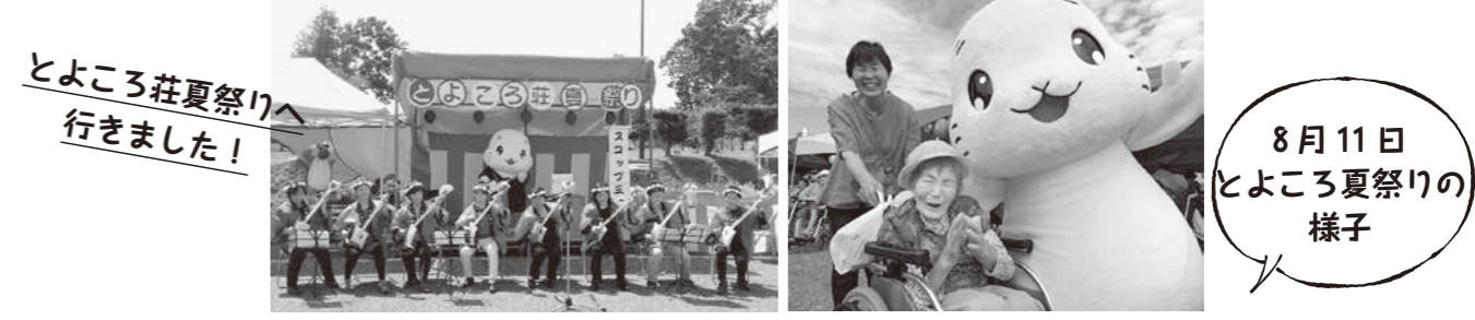
8月11日 とよこ夏祭りの様子

新しい着ぐるみに世代交代をしたトヨッピー社長。今年も元気に活動しています！ 今回は8月4日「とよこ荘夏祭り」と8月11日「とよこ夏祭り」での活動の様子をお伝えします。 次回は9月16日の産業まつりに出動するので、みなさんぜひトヨッピーに会いに来て下さい！