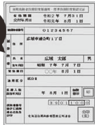
新しい減額認定証