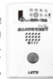
▲通話録音装置「振り込め詐欺見張隊」

相手からの電話着信時に「この電話は振り込め詐欺等の犯罪被害防止のため、会話内容が自動録音されます」とアナウンスを流し、通話内容を自動録音する装置です。アナウンスによる警告を行ない通話内容を録音することで、振り込め詐欺や悪質な電話勧誘等を抑止することができます。