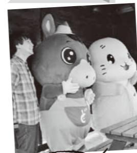
どさんこ君と初共演

『とよころ荘夏祭り』や『とよころ夏まつり』に参加したり、札幌テレビ放送のマスコットキャラクターどさんこ君との共演も果たしました! そんなお仕事の様子を写真でご紹介します!