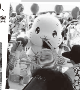
とよころ荘夏まつり