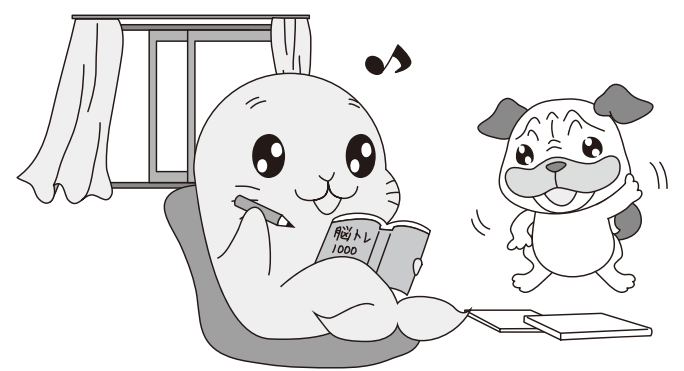
感染予防対策しっかりと!

次回社協だより発行は9月号となります(イベント等のお知らせは町広報をご覧ください)