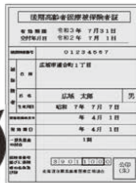
新しい保険証（水色）