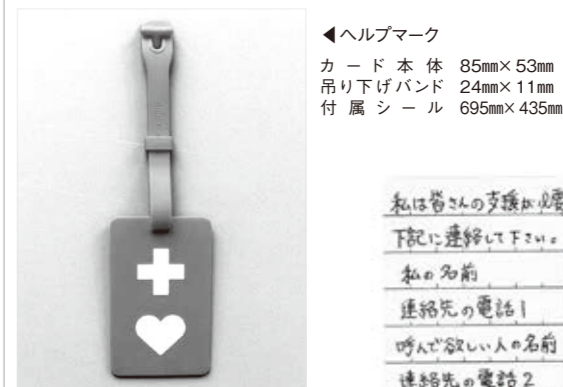
ヘルプマーク カード本体 85mm×53mm 吊り下げバンド 24mm×11mm 付属シール 695mm×435mm

義足や人工関節を使用している方、内部障がいの方や発達障がいの方など、外見からはわからない方が、周囲の方に配慮を必要としていることを伝えることで援助が得やすくなることを目的としています。