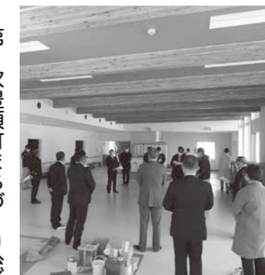
新しい食堂スペースで説明を受ける

取りによる消毒を行うなど、出来る限りの感染対策に取り組んでいる。各職員においてもマスクは常時着用し、日ごろから健康管理に努め、体調不良の場合には休暇を取るよう通知している。