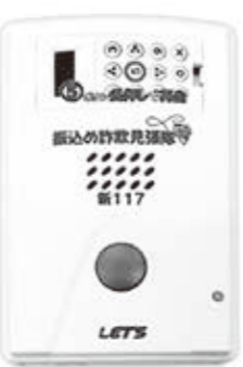
▲通話録音装置 【振り込め詐欺見張隊】

町では、振り込め詐欺や送り付け詐欺などの特殊詐欺や悪質商法の被害を未然に防止する対策として、電話の通話内容を自動録音する装置を無償で貸し出しています。