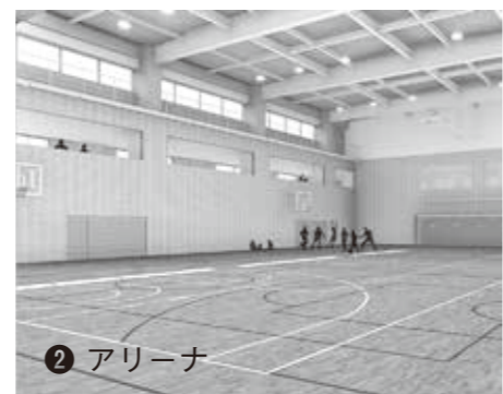
▲公式のバスケットボールコート1面が確保できます。