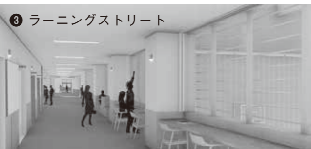
▲展示コーナーや机、椅子を配置して小・中学校をつなぐ賑わいのある空間になります。アリーナ側には大きなガラス窓を設け、屋内運動場の様子がうかがえます。