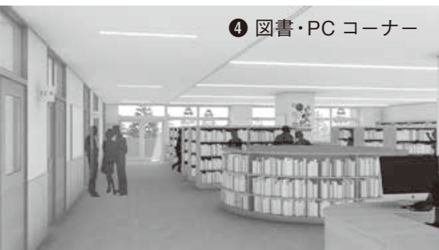
▲中学生教室と隣接した図書・PCコーナー。学習への興味と意欲を高め、自発的な学習空間を高めます。