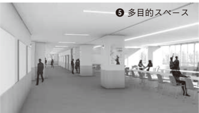
▲2階中央にある多目的スペースは、児童生徒や教職員が気軽に触れ合える場所になります。窓からは広々としたグラウンドの景観が楽しめます。