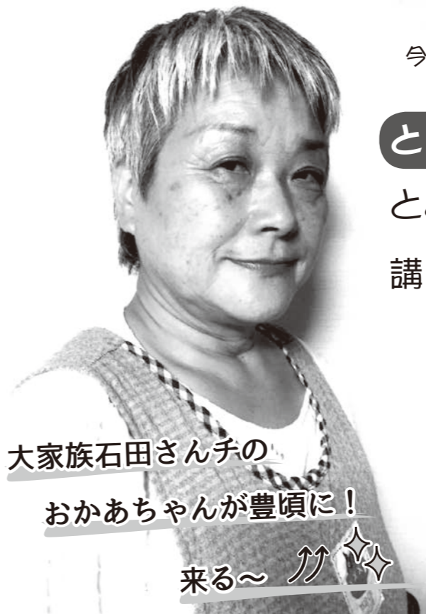
大家族石田さんちの おかあちゃんが豊頃に！ 来る~ ♪ ☆

新型コロナウイルス感染予防のため規模を縮小し今回は式典、講演会のみで開催となります。