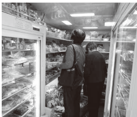
町内を回る移動販売車の車内