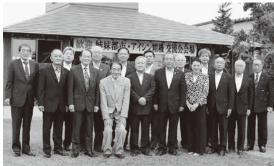
滑川市議会議長及び議員、相馬市議会議長などが来町し、交流を深めました

9月15日に、本町の姉妹都市である富山県滑川市から上田昌孝市長、原明議長をはじめ町議会議員10人が、福島県相馬市から米山光喜議長、堀川利夫教育長が来町しました。