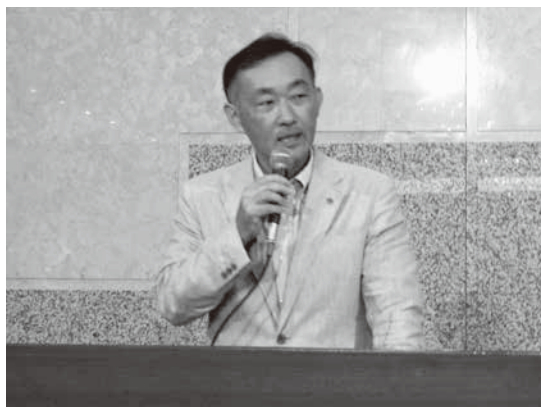
研修会講師の豊田健一氏

全道113町村から、569名の議員や職員が出席し、月刊総務編集長の豊田健一氏を講師に迎え「読者目線で親切な広報誌を作るには、手に取られ、読まれ、行動に結びつけるには」と題し、事前に提出された5町の議会広報を題材に、記事の書き方や写真を取り込んだレイアウトなど議会広報作成のポイントを学びました。