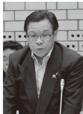
岩井 明 議員