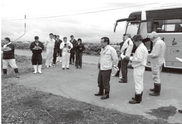
農作物作況調査の様子

本年は、馬鈴薯の植付作業や、てん菜の移植作業、豆類のは種作業は平年よりやや早く終了し、その後も順調に生育しているが、7月上旬から中旬の日照不足、8月初の高温により小豆の莢数が平年を大きく下回るなどの影響が出