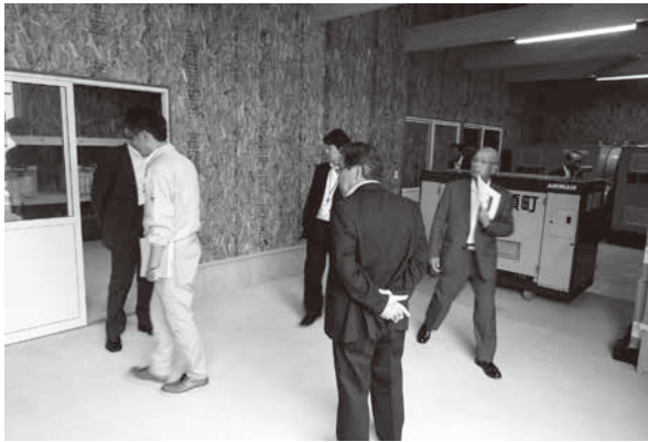
総合体育館西側の防災倉庫の調査