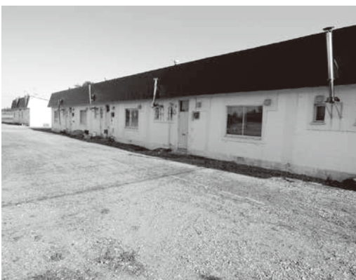
十弗市街の公営住宅

A 十弗市街の公営住宅は、現在入居している方が退去した時点で、解体する方向で考えている。また、町全体の住宅政策については、公営住宅の建設と民間住宅建設への助成制度により、ある程度の数は確保しているが、これからも幼児から高齢者まで安心して暮らせるまちづくりに向けて、住宅を整備していきたい。