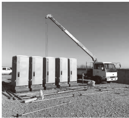
ジュエリーアイス観光客への仮設トイレ

A 前シーズンの実績やジュエリーハウス出店者、関係機関、地域住民からの要望を受けて、これまで1月10日頃から使用開始していた仮設トイレを12月20日頃から翌年3月上旬まで延長して使用するため。