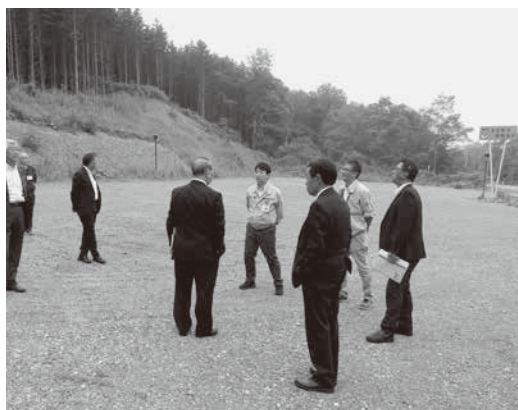
国道336号津波避難場所の調査