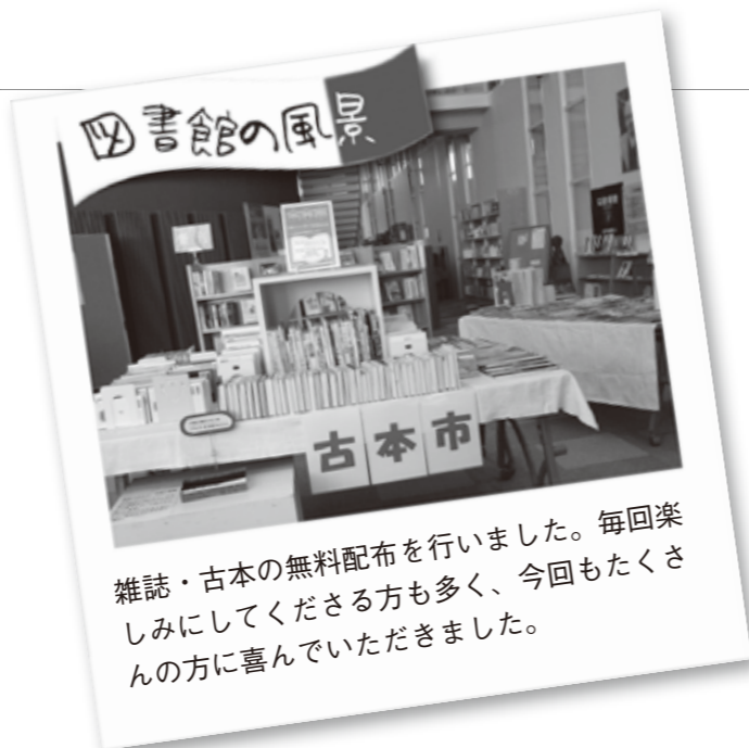
雑誌・古本の無料配布を行いました。毎回楽しみにして下さる方も多く、今回もたくさんの方に喜んでいただきました。

上記は新刊図書の一部です。 予約やリクエストも受け付けていますので、 お気軽にお問合せください。