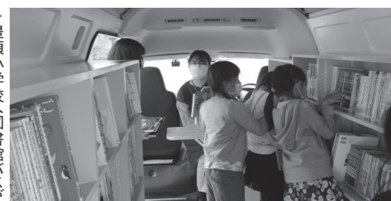
豊頃小学校へ図書館バスが運行したときの様子です。本が見やすくなったと、子どもたちで賑わいました。