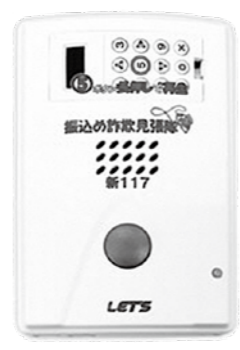
▲通話録音装置 [振り込め詐欺見張隊]

町では、振り込め詐欺や送り付け詐欺などの特殊詐欺や悪質商法の被害を未然に防止する対策として、電話の通話内容を自動録音する装置を無償で貸し出しています。