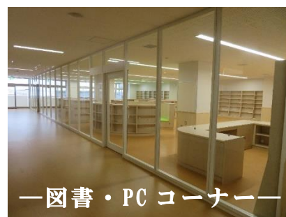
— 図書・PCコーナー —