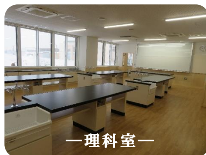
— 理科室 —