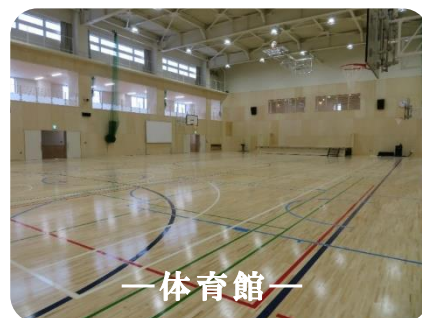
— 体育館 —