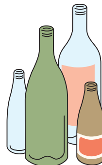
⑥ビン類（一部対象外）