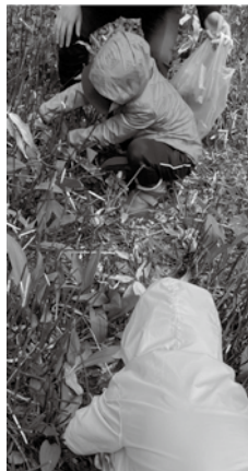
最初は虫が気になったが夢中で採取し始める2人

野菜苦手の娘も山菜に舌鼓 5月3日（水）午前中、役場のEさん、Mさんの案内で、父・長男・長女が人生で初めての山菜採りに出かけた。長女と長男はE先生、M先生に師事し、採取方法を教わった。袋いっぱいに行者ニンニクとコゴミを収穫し帰宅。得意げな顔で本日の戦果を、母に報告した。山菜はその日のうちに、醤油漬けと天ぷらに調理された。初めての春の幸に野菜の苦手な娘たちもおいしい！を連発。初めての美味に下処理の疲れも吹き飛んだようだった。