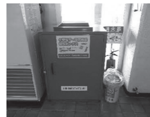
小型電子・電気機器回収ボックス