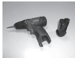
②充電式電池と家電を分ける