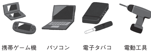
携帯ゲーム機 パソコン 電子タバコ 電動工具