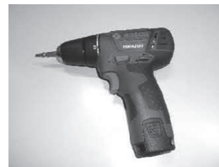
①充電式電池内蔵家電