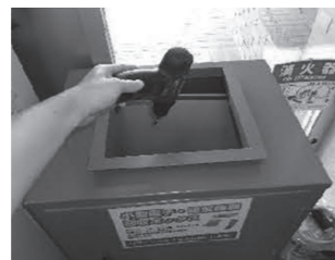
④小型家電をボックスへ

取り外せないものや対象有無の確認などのご相談は住民課生活環境係までお問合せ下さい。