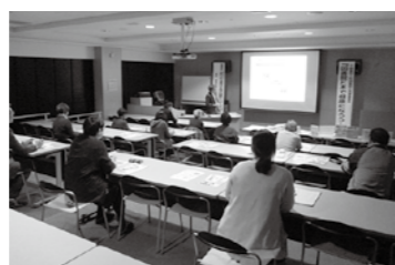
▲令和元年度開催時の様子

テーマ▽日本人の9割が信じている大間違いなお口の常識 日時▽11月25日(土) 14時〜15時50分 場所▽える夢館2階視聴覚室 対象▽いつまでも健康でありたいと思っている方(成人〜高齢者) 参加費▽無料 申込▽11月22日(水) までに、図書館へ直接または電話(☎579-5802)でお申し込みください。 ※広報誌折込チラシもご確認ください。 ▲令和元年度開催時の様子