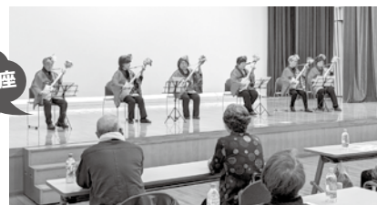
12月 帯広信用金庫様出前講座 スコップ三味線