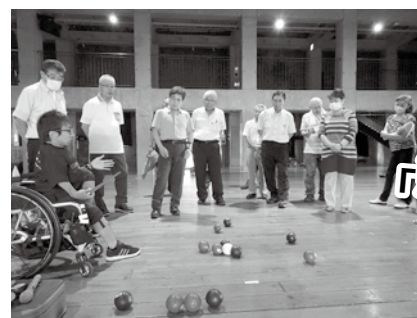
パラスポーツ 「ポッチャ体験」